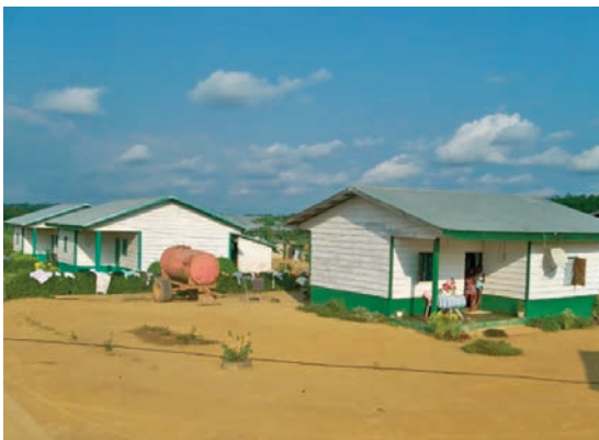
... une grande satisfaction aux populations et...