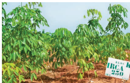
Une vue du JBG avec son clone.