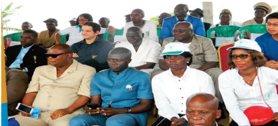
...en présence du directoire du site assis à la tribune officielle.