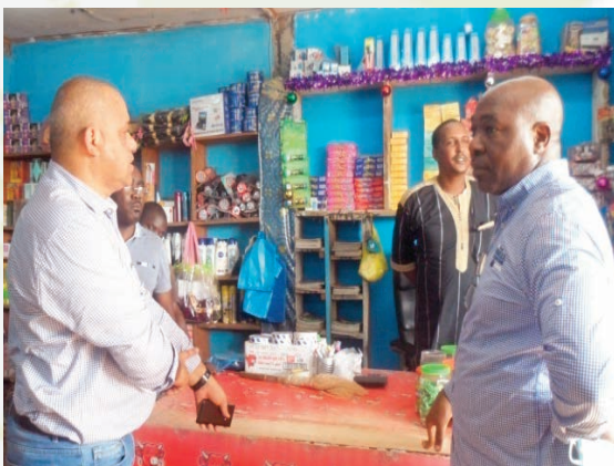
Les experts de la BAD visitant l'économat de-Kango...