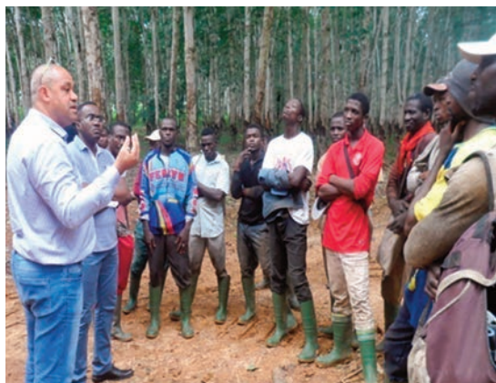
... puis échangeant avec les saigneurs du même site.