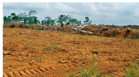
Les travaux préparatoires du planting 2017 à Kango avancent avec succès.