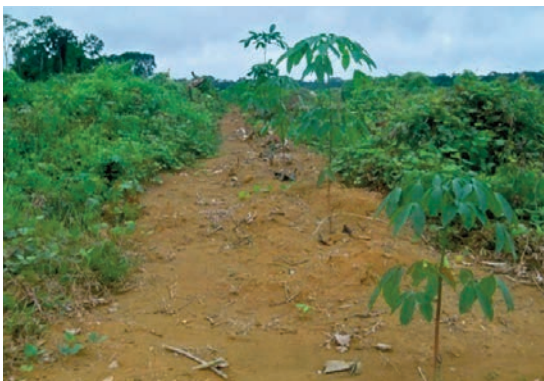
... et celui de 2016.