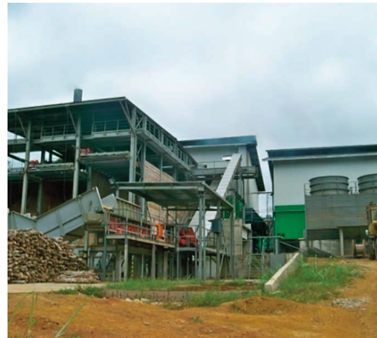
Le visage actuel de l'usine de la cogénération.