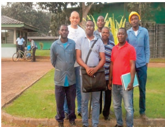
La délégation de la BAD a posé avec les délégués du personnel et l'HSE de Mitzic...