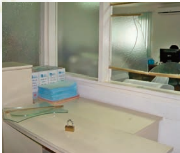
Un aperçu des dégâts à la caisse après le passage des cambrioleurs.

Précisons que ce n'est pas la première fois qu'il est enregistré un cas de vol à la direction générale à Libreville.