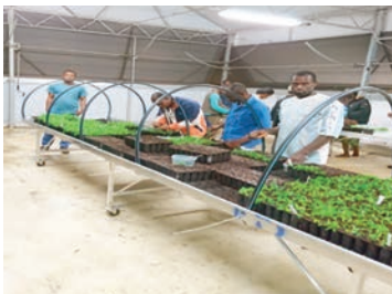
Opération de planting des vitro plants.