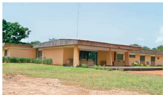
La case de passage de la CHP : une merveille.