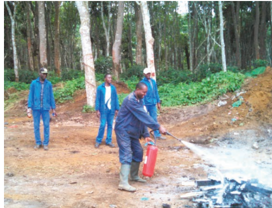
Un équipier de première intervention du quart 3 faisant face à un feu de classe A.