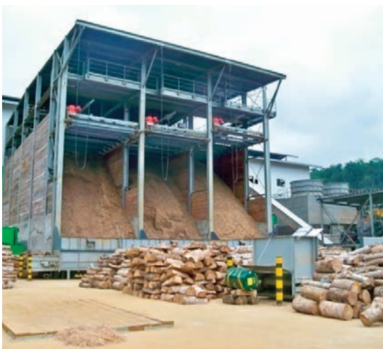
Le bois constitue la source d'énergie qui alimentera l'usine et l'ensemble du site.