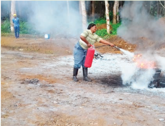
Une femme vaillante du découpage intervenant sur un feu réel.