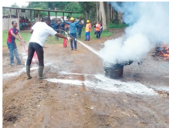
Les équipiers de première intervention (EPI) du quart 1 intervenant sur un feu de classe B à Mitzic.