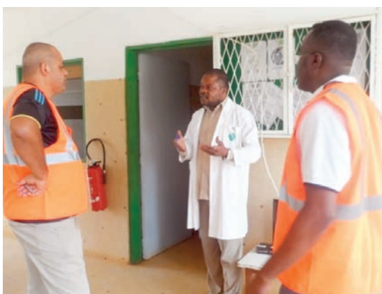
... avant de se rendre au dispensaire de Mitzic. Ici, avec le docteur de Domicile Santé