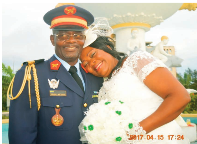
Le mariage est assurément l'événement le plus heureux chez une femme sur terre.