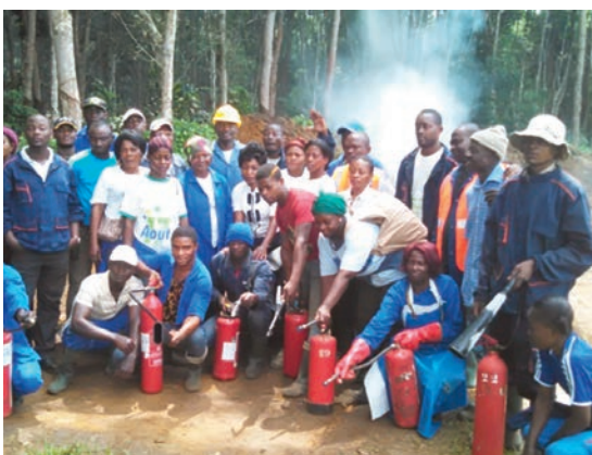
Exercice pratique de lutte contre les incendies avec la maintenance et les hors quart.