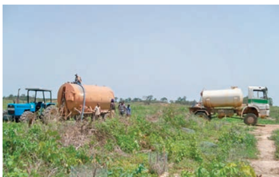
En raison de la faiblesse de la pluviométrie dans la région, le recours au camion citerne permet d'irriguer les champs.