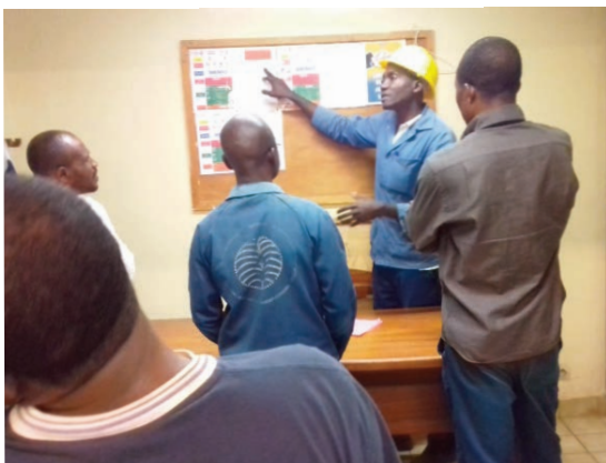
... et expliquant aux laborantins les risques liés à l'utilisation des produits chimiques.