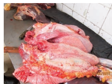
Absence de lésion de PPCB sur le poumon d'un bovin abattu le jour de la visite.