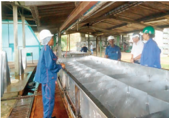
Une phase de l'audit dans les installations de l'usine.