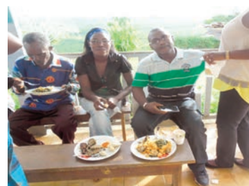
Des moments de bombance.