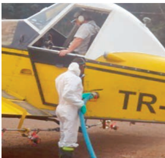
L'opération de traitement aérien sur les plantations de Mitzic et de Bitam a été un succès sans pareil.