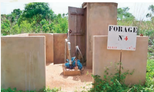
Un des forages de la plantation.