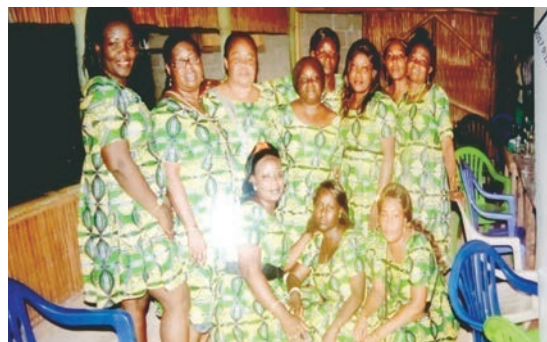
Un exemple de la fête des mères 2017.