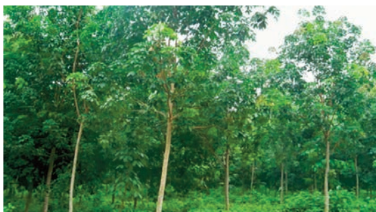
Un an après, la plantation de Zilé a retrouvé des couleurs.