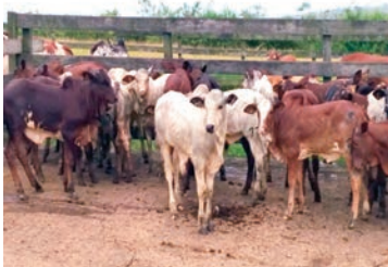
A la section Mukélengui, la présence des Zébus, leurs veaux en pure race ainsi que les produits de croisement ont marqué l'attention des experts en mission.