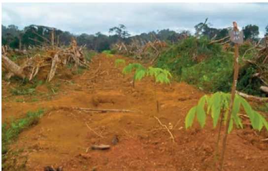
L'entrée du site de Mitzic est totalement ouverte au replanting.

A préciser que les opérations de planting et de replanting se déroulent deux fois l'an, tous les deux semestres, en adéquation avec les saisons de pluie.