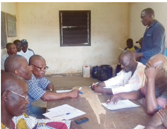
Les chefs d'équipe saignée sensibilisé sur la déclaration des accidents de travail au service agricole.