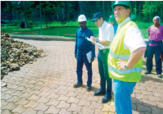
Les représentants de Michelin sur le site de Mitzic.

Cependant très pointilleux en matière de qualité, les représentants de Michelin ont noté quatre points importants à corriger, à savoir : la présence de contaminants, la mise en place d'un poste de vérification adapté pour permettre aux opérateurs de faire six visages de contrôle visuel ; la mise en place d'une station d'épuration, revenir aux bases des normes ISO (pincement rigide de l'usine, surveillance de la température du plastimètre Wallace et du four PRI) et mettre en œuvre des études de capacité.