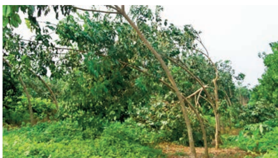
Une vue de la plantation après la tornade du 17 février 2016.

verdure et son enjolivure des grands jours. Preuve manifeste que les mesures d'urgence prises à l'époque après la catastrophe naturelle ont porté leurs fruits. Il s'agit notamment pour les arbres pliés ou courbés, d'un traitement par élagage des branches inférieures ayant entraîné le redressement progressif des arbres. La récupération de ces arbres a été à 100 %.