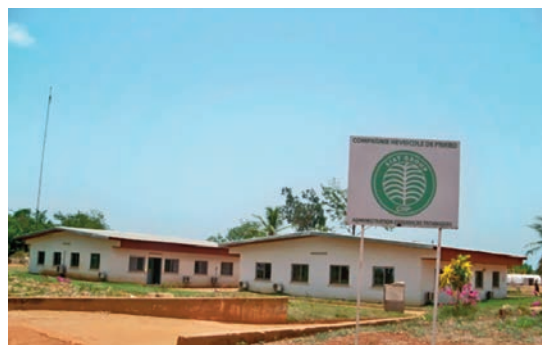
Les bâtiments abritant la direction de la CHP

Avec une cadence annuelle de planting de 500 ha d'hévéa à partir de 2018, la CHP entend, dans les années à venir, diversifier ses activités avec de nouvelles cultures telles que l'anacardier (noix de cajou) ou le Teck. Il s'agit d'une culture qui s'accommode bien avec l'environnement. Des essais de planting de cette culture seront faits pour apprécier sa réaction.