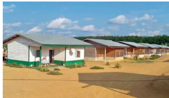
... travailleurs habitant le village.