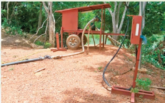
Une vue des installations et de la rivi re   partir de laquelle on s'approvisionne en eau pour irriguer les champs.