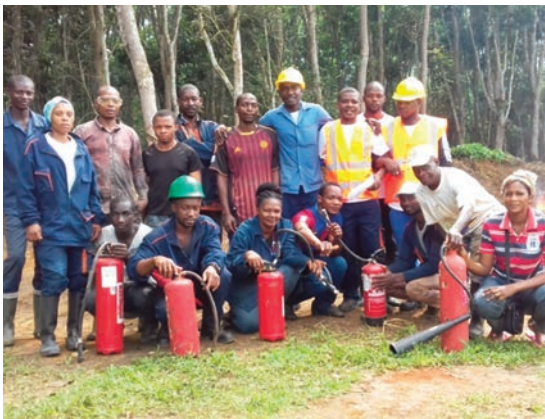
Exercice pratique de lutte contre les incendies avec le quart 1.