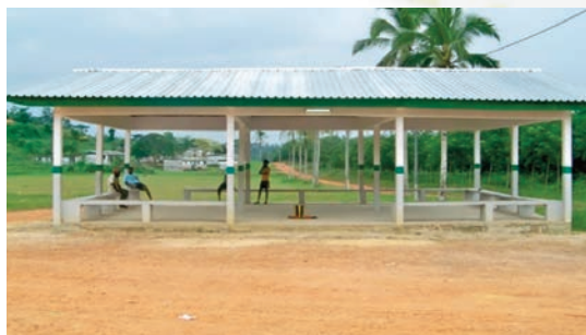
Le nouveau marché de Zilé est un vrai bijou.