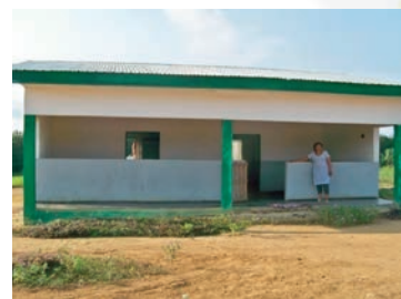
Une vue du dispensaire du V3 à Bitam.