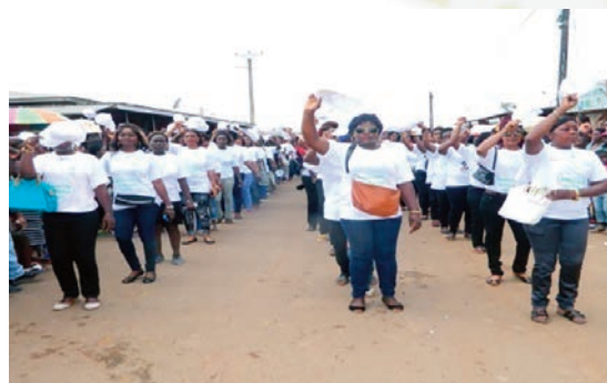
Les travailleurs du site de Mitzic ont donné un cachet particulier...