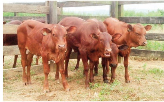
Veaux femelles Zépol 4.