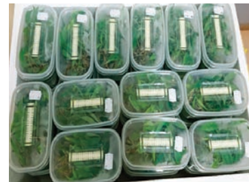
L'état dans lequel arrivent les vitro plants de Deroose plants en Belgique.