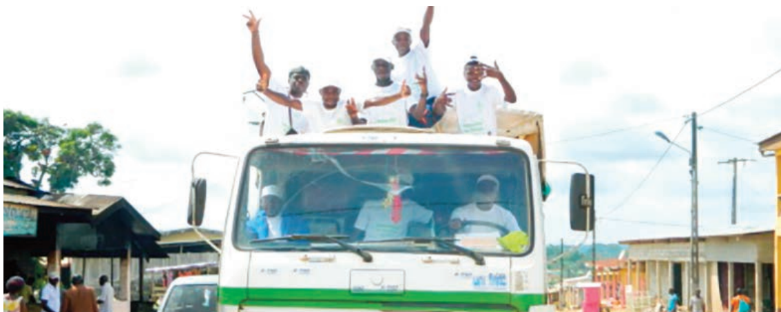
... à la réussite du défilé dans la localité ...