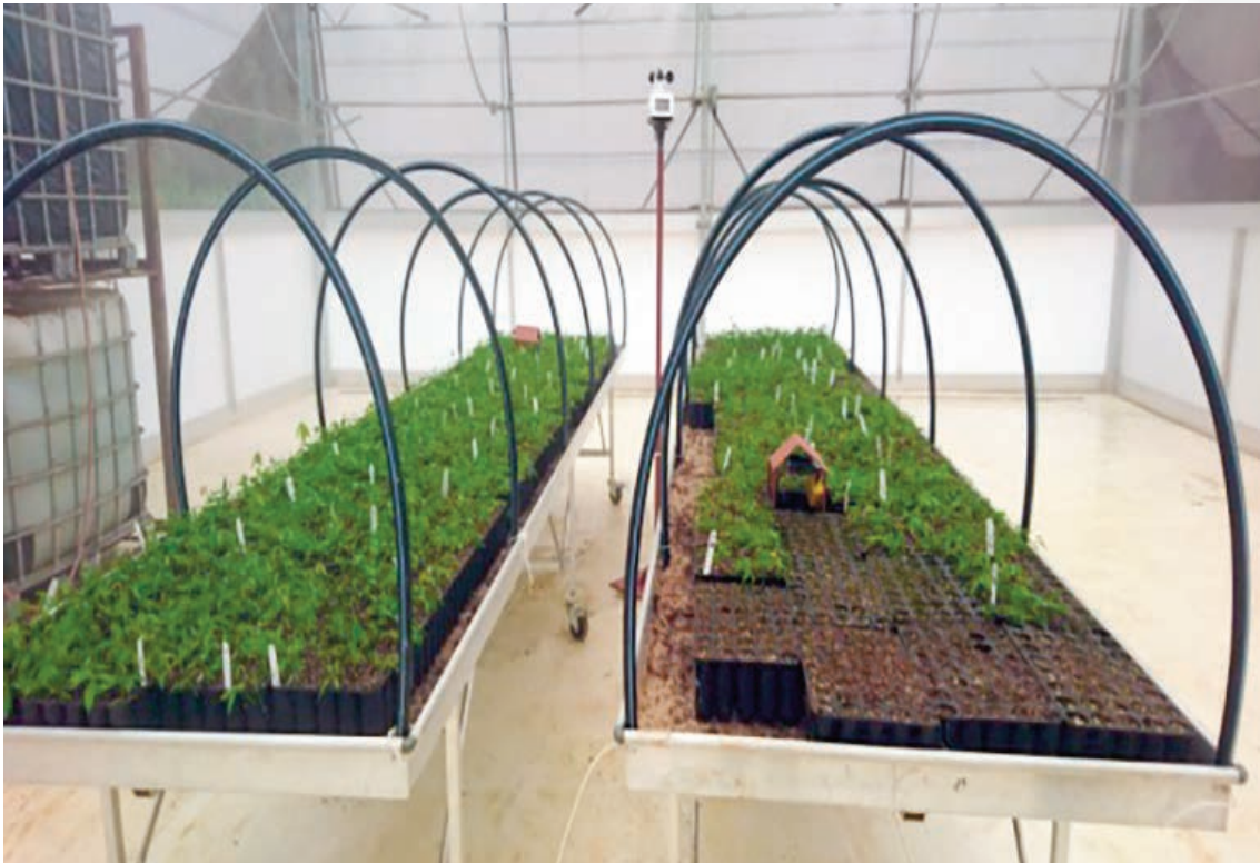
Le système de brumisation en marche.

6 semaines en phase humide, où la température et l'humidité sont contrôlées à l'aide d'un brumisateur et 10 semaines en phase sèche afin de préparer les plants aux conditions climatiques environnementales (température, humidité, luminosité) avant leur transfert en pépinière. Les plants sont transférés de la Serre à la pépinière dans des sacs. Lorsque les plants ont environ 1 m de hauteur, ils sont prêts à être transplantés en plantation en début de saison des pluies pour y être plantés définitivement.