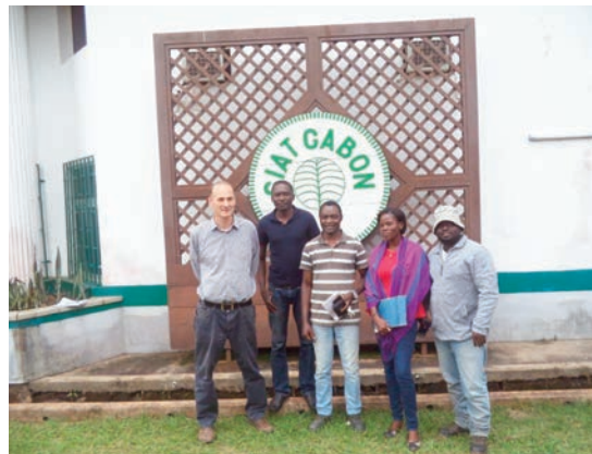
Le département HSE en inspection à Bitam.