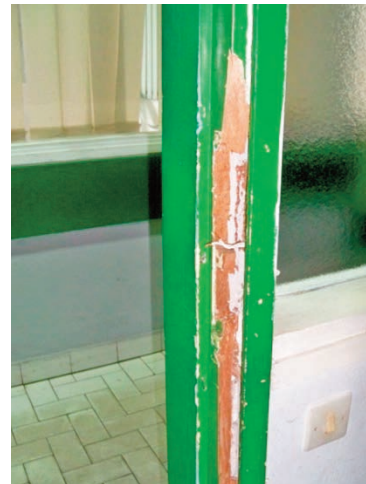
La porte a subi l'assaut des bandits.