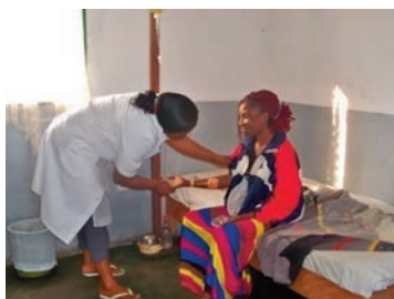
... puis visitant une malade hospitalisée.