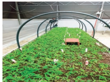
Après le planting des vitro plants, ils sont prêts à être couverts.