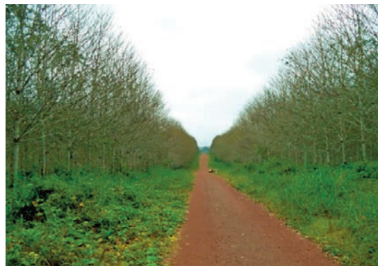
Une image de la plantation après l'épandage des produits défoliants.

Selon les techniciens de l'entreprise, la reconstitution des arbres (la refoliation) se fait de façon visible au bout de 15 jours.