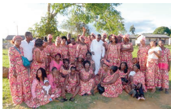
Les femmes de la plantation de Mitzic sont tellement bien organisées ...

Les femmes travaillant dans la plantation de Mitzic ont pris, depuis quelques années, l'habitude de se célébrer elles-mêmes. La fête des mères est souvent l'occasion pour ces mères d'oublier les contraintes professionnelles auxquelles elles font quotidiennement face. Le 27 mai dernier à l'occasion de la fête des mères, elles ont encore réaffirmé leur engagement de parler le même langage et leur vivre-ensemble en tant que mères. Danses et nourriture ont rythmé cette cérémonie. Bonne fête mamans !