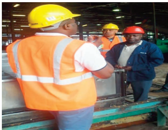
... puis a visité l'usine de caoutchouc ...