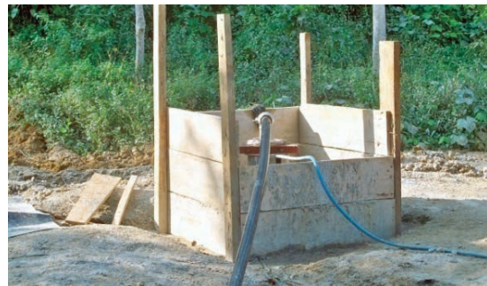
Le forage du V3 ici, procure...

Ils sont trois au total, les forages réalisés dans la plantation de Bitam. Ils correspondent au nombre de villages présents sur le site. V1, V2 et V3. Avec ces équipements sociaux, les travailleurs peuvent se frotter les mains d'avoir de l'eau de qualité en toute saison. Une action sociale saluée par tous.