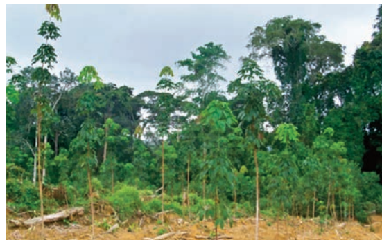
Le planting 2015 dans la zone extension.