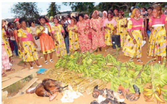
... qu'elles rendent les hommes du site jaloux.