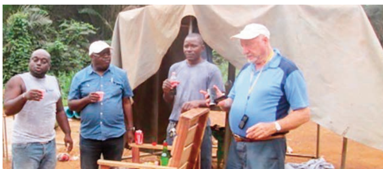
De l'utile à l'agréable, place au drink pour saluer le bon job de l'équipe de forage.