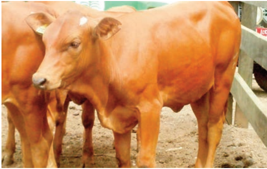
Veau femelle N'dapoli 2.

de format plus grand : Sénépol, Néllore et Sindi ; accélérer la croissance du cheptel en favorisant la naissance de veaux de sexe femelle. C'est aussi le lieu de préciser que 328 vaches et génisses ont été inséminées en février 2017 avec de la semence sexée femelle de race Sénépol. Les naissances sont attendues en novembre 2017. En revanche, près de 1 500 vaches et génisses seront inséminées à la fin de l'année 2017 avec de la semence sexée femelle de race Sénépol, Néllore et Sindi.