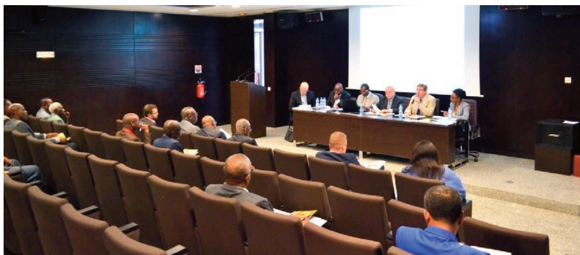
Une vue de la salle en début de réunion. Les actionnaires arrivant progressivement.