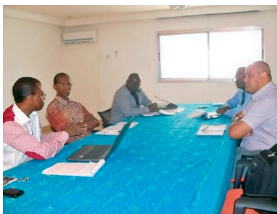
Les experts de la BAD (à droite) en réunion avec les responsables de Siat Gabon à la direction générale, à Libreville.