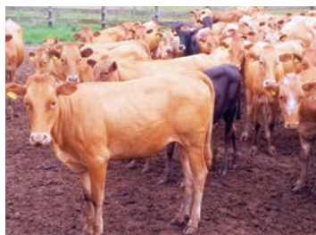
A la section Douli, des génisses N'dama indemnes de PPCB.