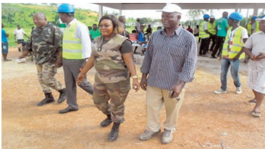
L'inauguration du marché a mobilisé du beau monde .

Il avait été totalement détruit par l'orage qui avait soufflé sur la plantation de Zilé, le 17 février 2016. Douze mois plus tard, les travailleurs et les populations ont retrouvé un nouvel espace commercial plus commode, après quelques mois de travaux de reconstruction. C'est la société SGSG BTP, maître d'ouvrage, qui a officiellement remis le bâtiment à la direction du site, le 8 avril dernier, à la grande satisfaction des populations et des travailleurs.