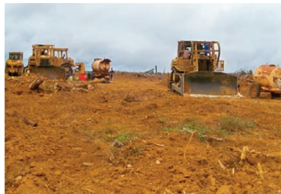
La préparation de terrain en zone C : comme une fourmière.