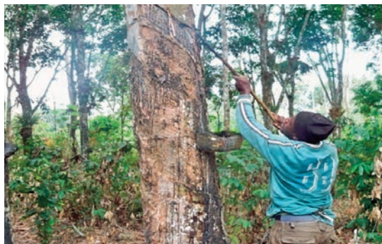
Le déficit de saigneurs à Kango est rédhibitoire à la performance économique du site.

Le site de Kango a un besoin de 180 saigneurs pour exploiter 1 750 ha d'hévéa en production. Malgré la mise à disposition des saigneurs sortis de l'école de saignée d'Ikembélé, Kango accuse toujours un déficit de main-d'œuvre dans cette spécialité. Par exemple, sur un total de 36 saigneurs en provenance d'Ikembélé depuis le 14 juin 2017, il ne reste plus que 14 saigneurs nationaux à poursuivre l'aventure avec l'agro-industriel belge ; les 22 autres ayant déserté les lieux. Toute chose qui rend difficile l'exploitation optimale de la plantation.